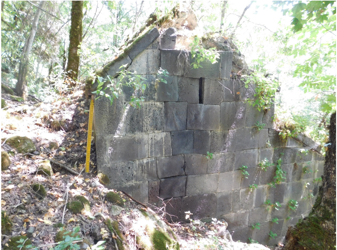
სურ. 22 Pic.

ეკლესიების გარდა კომპლექსი აერთიანებს სამ საერო ნაგებობას, რომელთაგან ერთი მთავარი ტაძრის აღმოსავ-