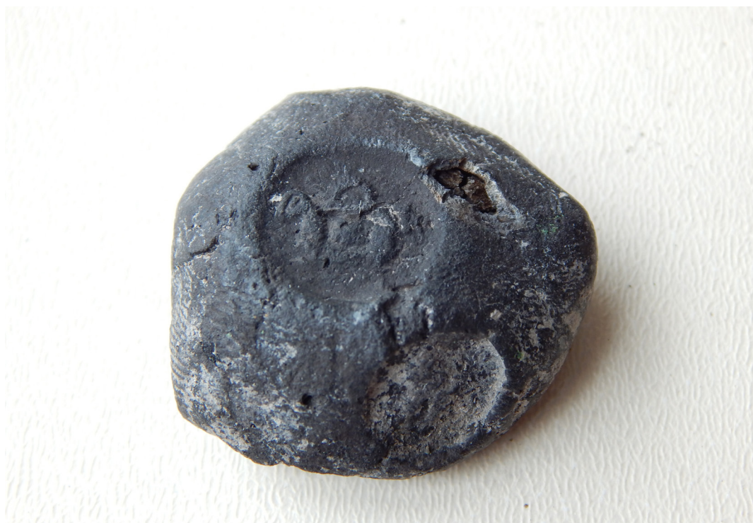
სურ. 15 Pic.