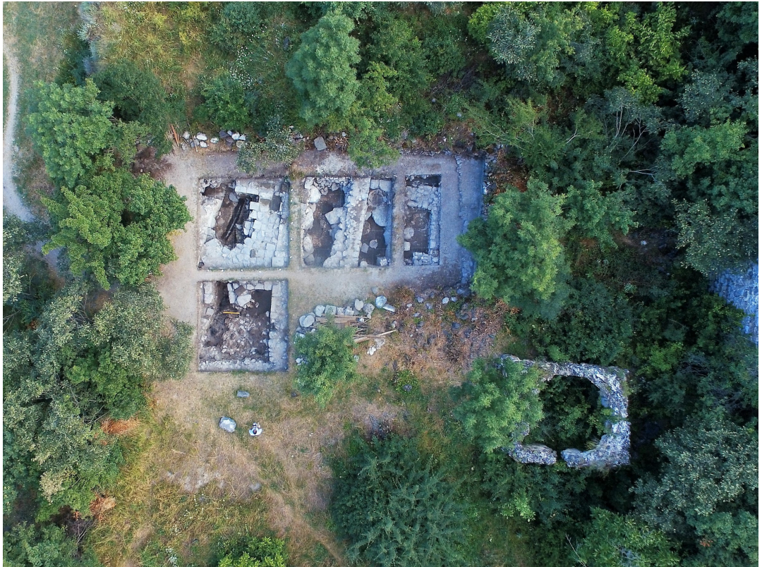
სურ. 1 Pic.

საველე სამუშაოების დაწყებამდე ზუსტად განისაზღვრა ის მონაკვეთები, რომელთა გათხრებიც გეგმით გათვალისწინებულ ვადებში უნდა განხორციელებულიყო; კერძოდ, №60, №67,