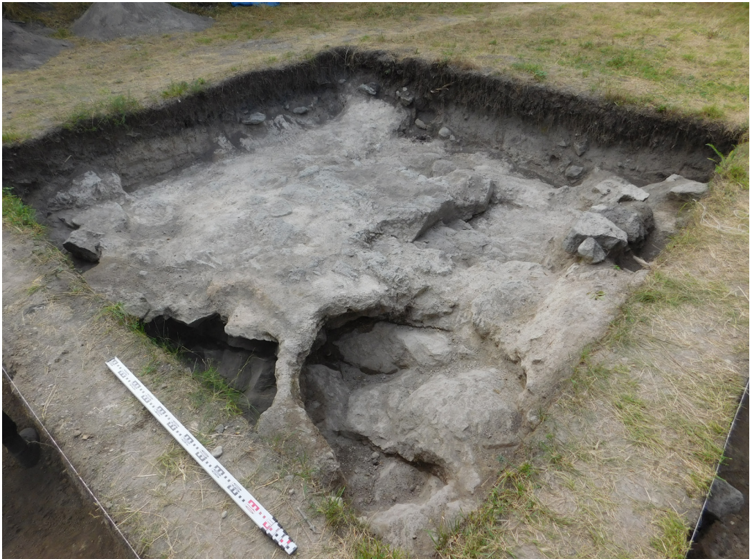
სურ. 13 Pic.

ერთ-ერთ ყველაზე მნიშვნელოვან მონაპოვრად N8 თხრილში აღმოჩენილი, სავარაუდოდ, მე-5-6 საუკუნეების სასანური პერიოდის ბიტუმის ბულა წარმოადგენს, რომლის მოხვედრასაც სამშვილდეში, აღნიშნული პერიოდის ქვემო ქართლსა და ირანს შორის მჭიდრო ურთიერთობებით ვხსნით. სამშვილდის ბულას ანალოგები საქართველოში არ გააჩნია. მისი მსგავსი პარალელები, დაცულია ირანის ეროვნულ მუზეუმში, თუმცა, იქაც იშვიათობას წარმოადგენს. ნივთი ამჟამად შესწავლის პროცესშია და უახლოეს ხანებში მას ცალკე სტატია მიეძღვნება (სურ. 15).