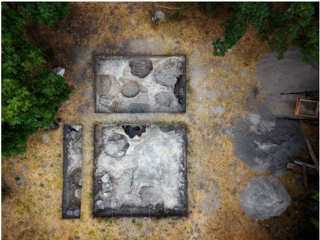
სურ. 12 Pic.

ამავე თხრილიდან მომდინარე ბრინჯაოს ხანის შუა და გვიანი ეტაპის მასალები, ძირითადად, კერამიკითაა წარმოდგენილი და ხასიათდება შავპირილა ზედაპირით, მონაცრისფრო სარჩულითა და წერტილოვანი ორნამენტით