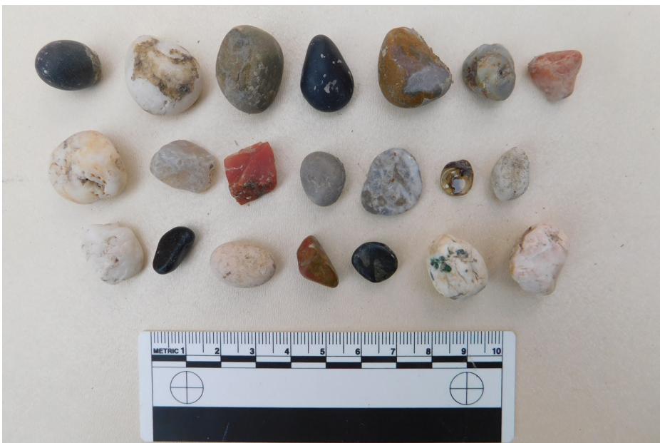
სურ. 8 Pic.