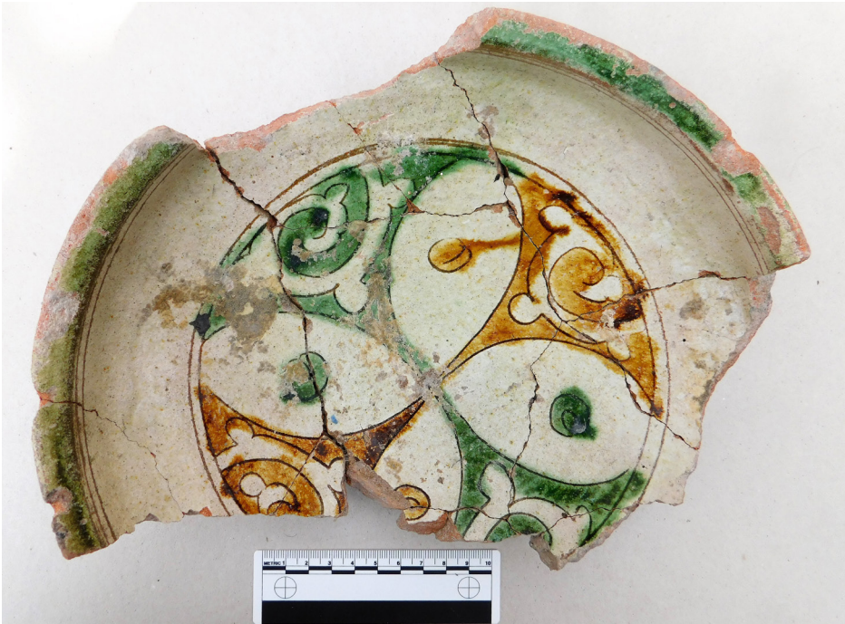
სურ. 7 Pic.

მიტყრილითა და ნანგრევით არის დაფარული. გათხრების დასრულება, ზუსტი პარამეტრებისა და ფუნქციის განსაზღვრა მომავალი კვლევა-ძიების საქმეს წარმოადგენს.