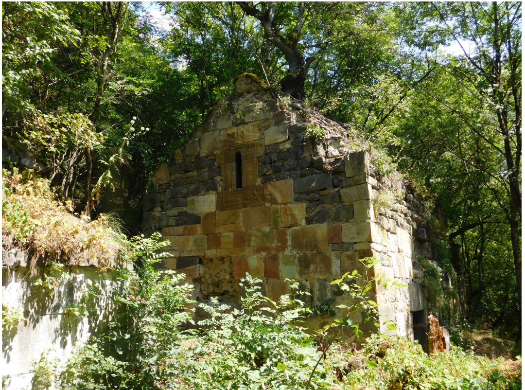
სურ. 21 Pic.

შაოებისა და უბნების განსაზღვრა. მონასტერი ორი დარბაზული ტიპის ეკლესიას აერთიანებს, პირობითად მთავარ ტაძარსა და მცირე ეკლესიას. მთავარი ტაძრის ზომებია 9x5 მ (ზუსტი ზომების განსაზღვრა ნაყარი მიწის ფენისაგან გაწმენდამდე ვერ ხერხდება), იგი ნაგებია ბაზალტის ფლეთილი ქვითა და გათლილი ქვიშაქვის კვადრებით (სურ. 21). დასავლეთისა და აღმოსავლეთის სარკმლები მოჩუქურთმებული ყოფილა, ჩუქურთმიანი ქვები და სხვადასხვა არქიტექტურული დეტალები ტაძრის ირგვლივ ფოთლებით დაფარულ შრეშიც დავაფიქსირეთ. ინტერიერში მოზრილი და საშუალო ზომის ქვებია, რომლებიც ფარავს იატაკის დონეს, თუმცა, მაინც ცხადია, რომ ტაძრის იატაკი ექსტერიერის დონესთან შედარებით 80 სმ-ით დაბლაა. მთლიანად