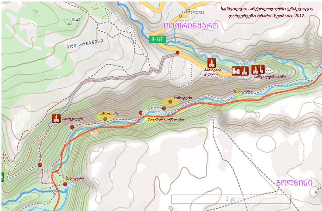
სურ. 18 Pic.

შვილდის შიდა ციხეს. კონსტრუქციული თვალსაზრისით კი მდინარის ორსავე ნაპირზე განლაგებულ ბურჯებზე გადადებული თალი უნდა ყოფილიყო, ადვილი მოსალოდნელია წყალში საყრდენების გარეშე. ბურჯებს შორის მანძილი 20-25 მ-ია, სიგანე კი 3 მ. აღნიშნული ხიდი 1968 წელს მოინახულა აკადემიკოსმა ლ. ჭილაშვილმა და ცნობები მის შესახებ გამოაქვეყნა მონოგრაფიაში - „ქალაქები ფეოდალურ საქართველოში“. ჩვენ მიერ მოხდა ნახიდურის ზუსტი გეოგრაფიული კოორდინატების (GPS) განსაზღვრა, შემორჩენილი ბურჯების ფოტოგადაღება და მიმდებარე ტერიტორიის დათვალიე-