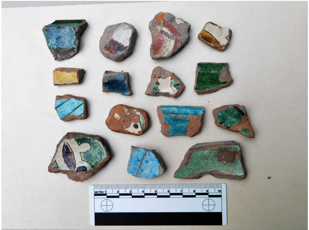
სურ. 11 Pic.

რეგებისა და ანატკეცების რაოდენობა კლებულობს და 2.30-2.50 მ სიღრმეზე თითქმის აღარ გვხვდება. ეს მაშინ როდესაც კორდოვანი ფენის ქვეშ, მიწის ზედაპირის სიახლოვეს მათი რაოდენობრივი მაჩვენებელი თითქმის უტოლდებოდა განვითარებული შუა საუკუნეების კერამიკის რაოდენობრივ მაჩვენებელს. ობსიდიანის ანამტკრევა ანატკეცების რაოდენობის ასეთი კლება დაღრმავებასთან ერთად შემდგომ დაკვირვებასა და ანალიზს მოითხოვს.