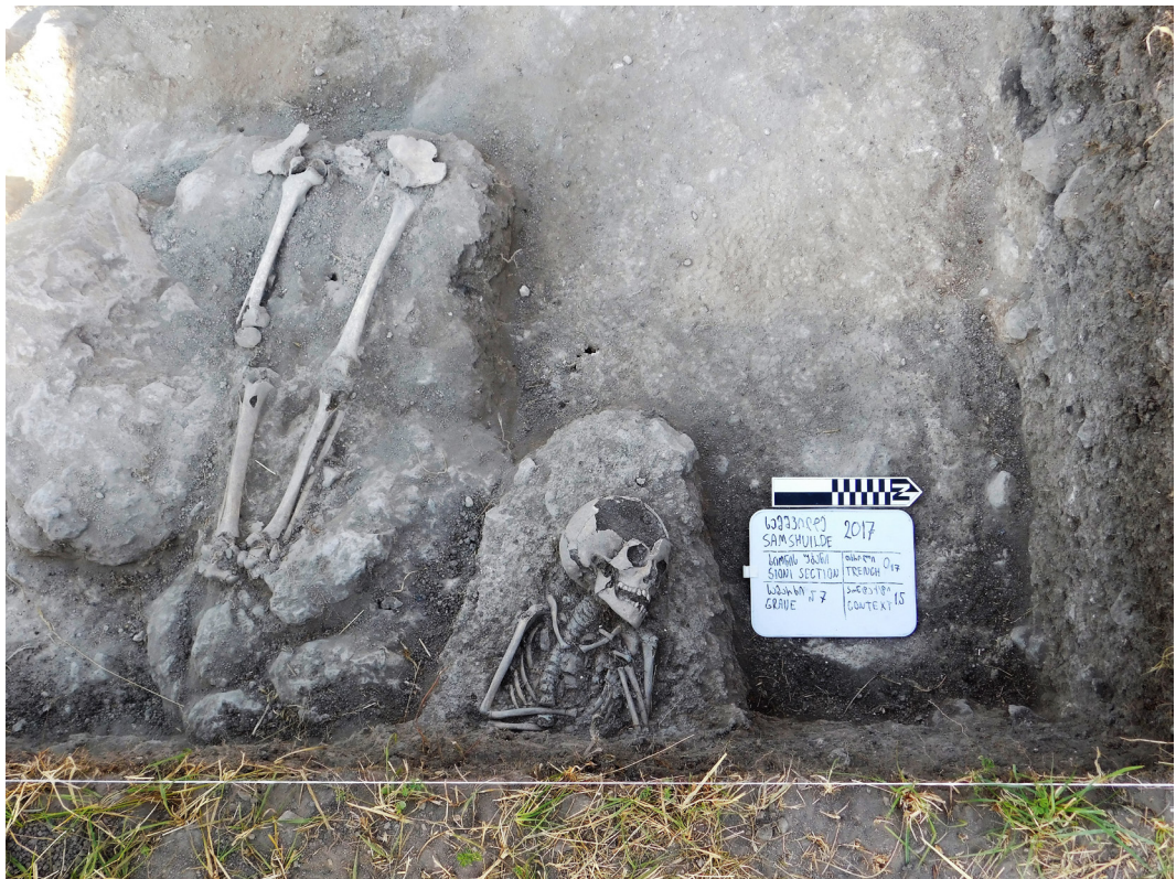
სურ. 17 Pic.

O17 თხრილის კვლევის დროს შუა საუკუნეების კიდევ რამდენიმე სამარხი იქნა გამოვლენილი. მათ შორის მნიშვნელოვანია რიგით №7 სამარხი, რომელიც 12-15 წლის ინდივიდს განეკუთვნება და რომლის ძვლოვანი ნაშთებიც კარგად არის შემონახული (სურ. 17). O8 თხრილის სამარხი №1-ის მსგავსად, №7 სამარხიც მიწის გასათხრელ მონაკვეთში ვრცელდება და მისი კვლევის დას-