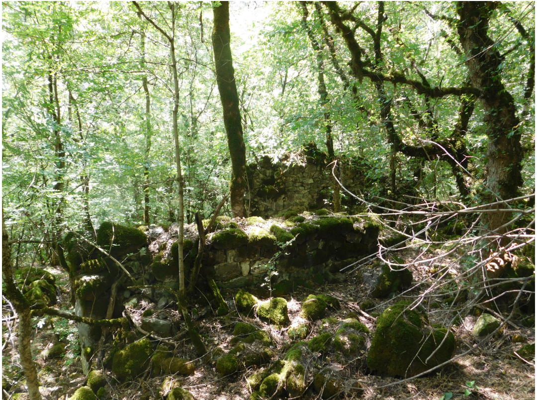
სურ. 19 Pic.

ძეგლია, რომელიც შესაბამის კვლევასა და შესწავლას საჭიროებს. თავისთავად ცხადია, რომ მდ. ხრამის ნაპირის გასწვრივ ასეთი ტიპის დასახლება შემთხვევითი არ უნდა იყოს და მისი სახით გაცხოველებულ სავაჭრო-ეკონომიკურ თუ კულტურულ ურთიერთობებში ჩართულ დასახლებულ პუნქტთან უნდა გვექონდეს საქმე.