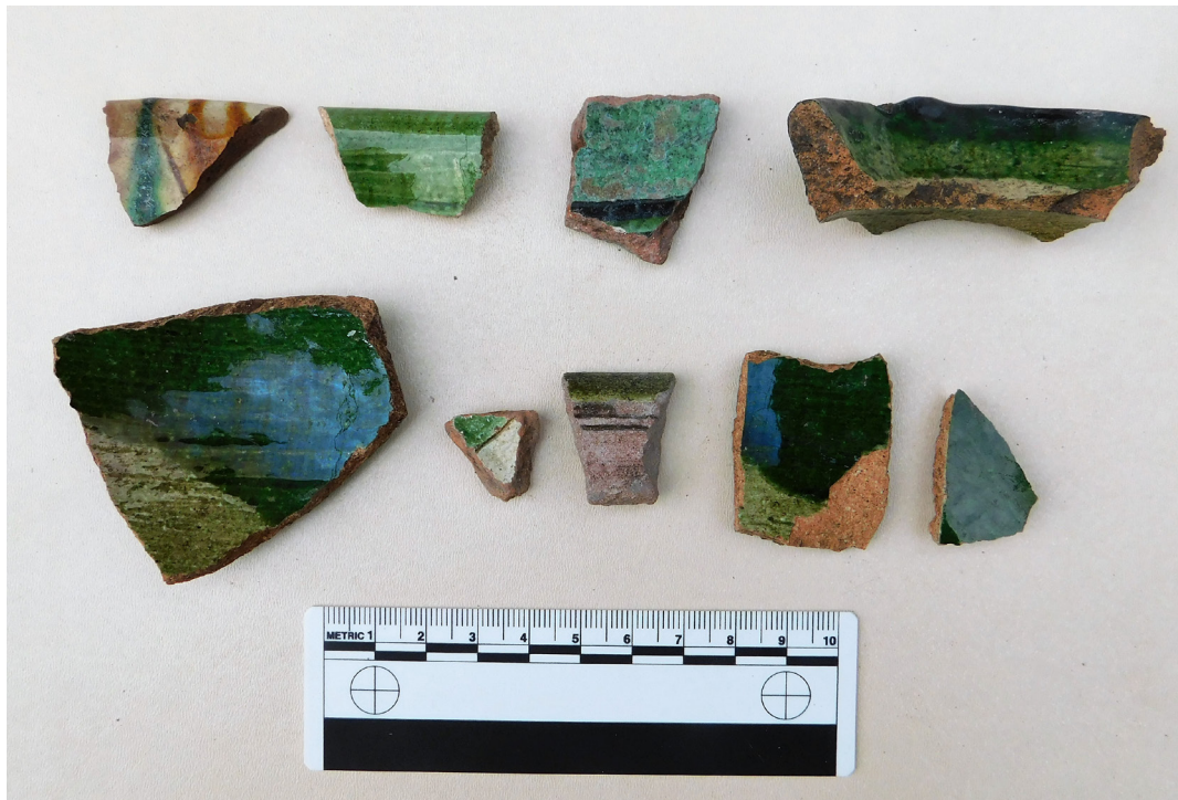
სურ. 14 Pic.