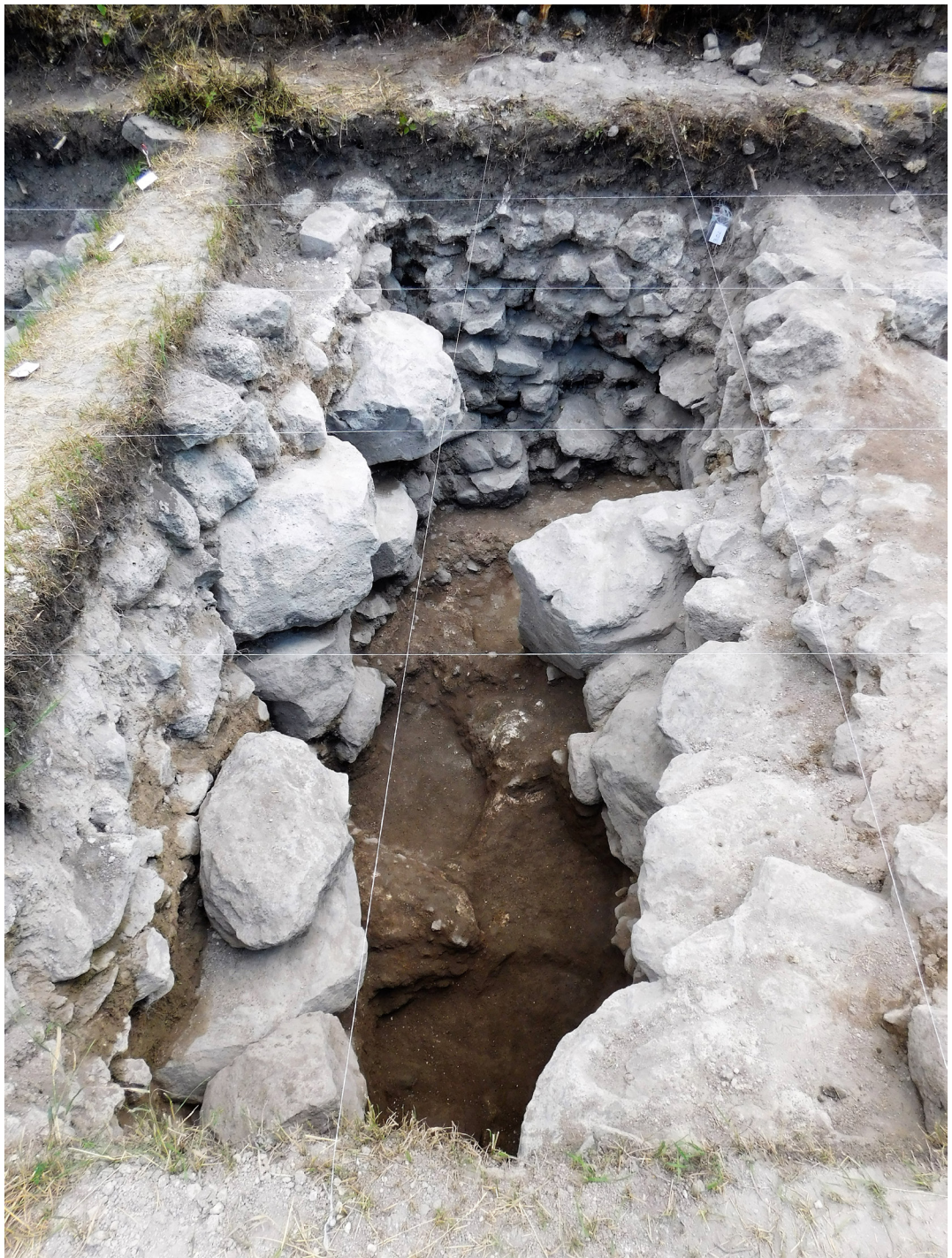
სურ. 5 Pic.

თხრილი №68 (N 41°30.386' E 044° 30.129'. El.800.)