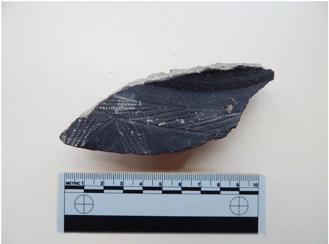
სურ. 10 Pic.

• უნდა აღინიშნოს ის ფაქტიც, რომ გათხრების მთელ ფართობზე, დაღრმავებასთან ერთად ობსიდიანის ანამტე-