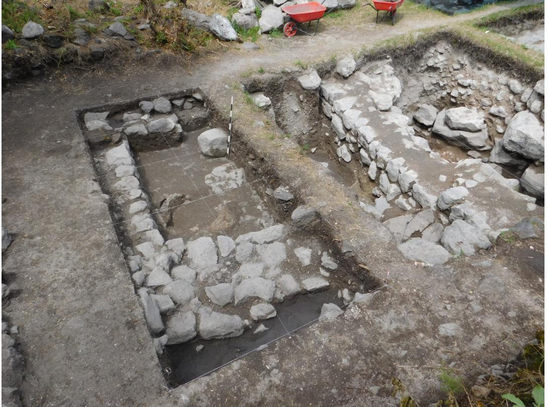
სურ. 6 Pic.