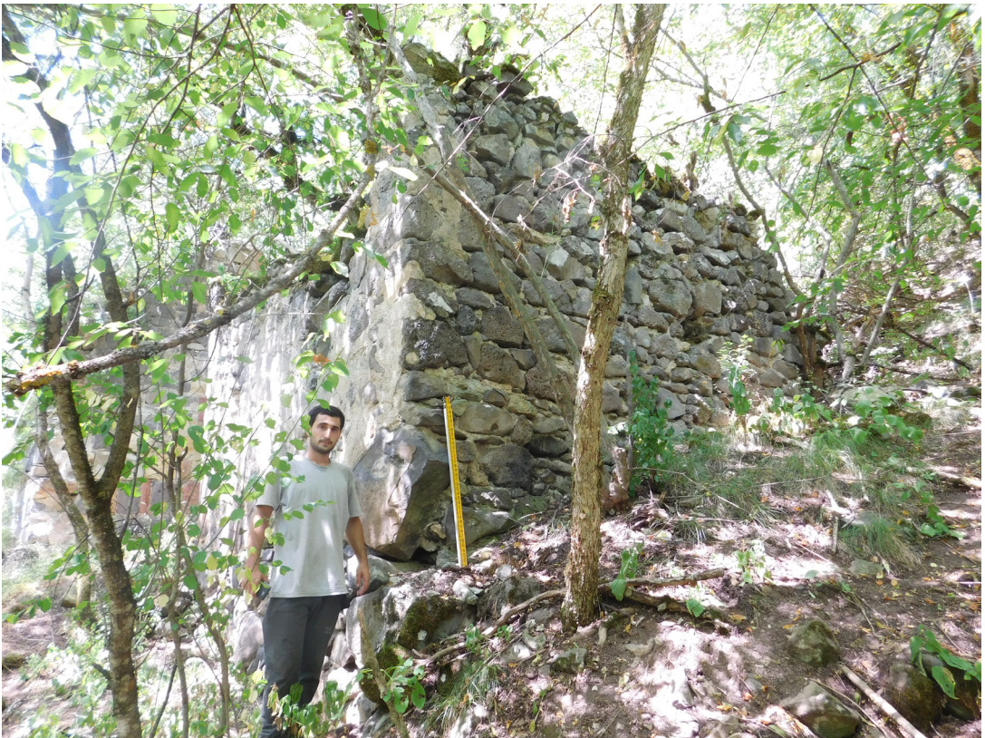
სურ. 23 Pic.

მიუხედავად იმისა, რომ ჩვენს ჯგუფს კომპლექსის ტერიტორიაზე სადაზვერვო შურფები არ გაუკეთებია, ზედაპირულად მაინც დიდი რაოდენობით კერამიკის ფრაგმენტები აიკრიფა (კრამიტები, მოზრდილი და საშუალო ზომის საყოფაცხოვრებო კერამიკა), რაც აქ მძლავრი სამოღვაწეო კერის არსებობას ადასტურებს.