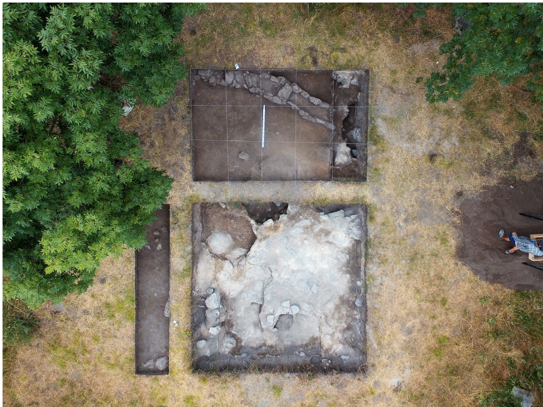
სურ. 2 Pic.

რიშს და ასევე, გადაეგზავნა კულტურული მემკვიდრეობის დაცვის ეროვნულ სააგენტოს.