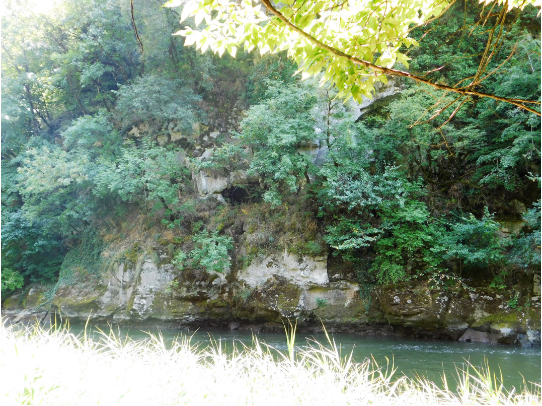
სურ. 20 Pic.

მღვიმეები ძალზე დიდი რაოდენობით სხვადასხვა პერიოდის არქეოლოგიურ მასალას შეიცავს (როგორც ისტორიული, ისე პრეისტორიული პერიოდის) ცხადია, აუცილებელია აღნიშნული მღვიმეების ინტერიერში სადაზვერვო შურფების გაკეთება და აუცილებლობის შემთხვევაში მათი სტაციონარული შესწავლა. მსგავსი ტიპის მღვიმეებში, რომლებიც ასევე ხრამის კანიონში მდებარეობს, 2015-2016 წლებში საქართველოს უნივერსიტეტის სამშვილდის არქეოლოგიურმა ექსპედიციამ ქვის ხანის ფინალური ეტაპის, ბრინჯაოს ხანის სხვადასხვა პერიოდისა და შუა საუკუნეების სხვადასხვა ფაზის არქეოლოგიური მასალა გამოავლინა.