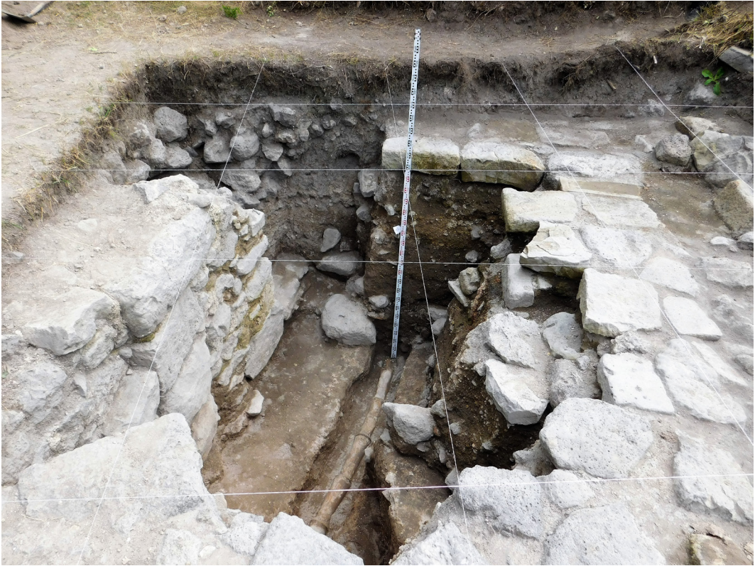
სურ. 4 Pic.

სახით გვხვდება, მზა იარაღი ერთეულია, უპირატესად - საჭრისები ან საფხეკები. ლითონის ნივთები რკინის ლურსმნებით წარმოსდგება, რომლებს, როგორც სხვა დანარჩენი არტეფაქტები საქართველოს უნივერსიტეტის არქეოლოგიურ მუზეუმშია გადატანილი. უნდა აღინიშნოს, რომ 2017 წელს ციტადელის №69 თხრილში მო-