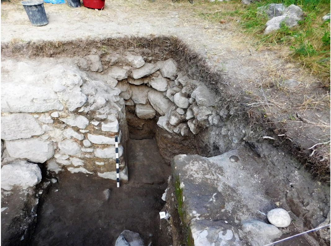
სურ. 3 Pic.

პარალელურად, თხრილის ცენტრალურ ნაწილში მიმდინარე გათხრებმა ნ/წ-დან 4.87 მ სიღრმეზე დააფიქსირა კრამიტყრილი (კონტექსტი №29), ხოლო მის ქვეშ კი ნაწილობრივ დანგრეული სათავსოს კირით მოლესილი იატაკის ფრაგმენტი. აღსანიშნავია, რომ სათავ-