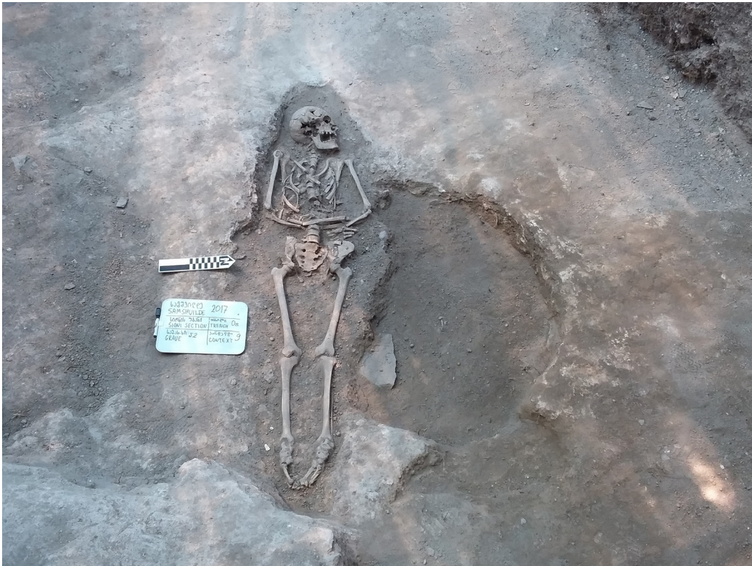
სურ. 16 Pic.

აღწევდა, ხოლო თუ დედაქანში ორმოს დაღრმავება ვერ ხერხდებოდა მისი სიღრმე 0.5 მ-საც კი არ აღემატებოდა. ყველა ორმოდან მომდინარე მასალა თითქმის იდენტურია და წარმოდგენილია ე.წ. „ნასუფრალი ძვლებით“, სადაც ჭარბობს მსხვილფეხა საქონლის ძვლები და ასევე, სხვადასხვა პერიოდის არქეოლოგიური მასალა. მათ შორის კარგად ნაპრიალვეი შავზედაპირიანი კერამიკა, რომელთაც ახასიათებს წერტილოვანი ორნამენტით შევსებული სარტყლები და წნევით გამოყვანილი ნაპრიალვეი ზოლები. ამავე სამეურნეო ორმოებიდან დიდი რაოდენობით მომდინარეობს ობსიდიანის სხვადასხვა ზომის ანატკეც-ანამტვრევები და ნამზადი იარაღი, რომელიც მსგავსია გასულ წლებში ამავე უბანზე აღმოჩენილი ამ ტიპის მასალებისა.