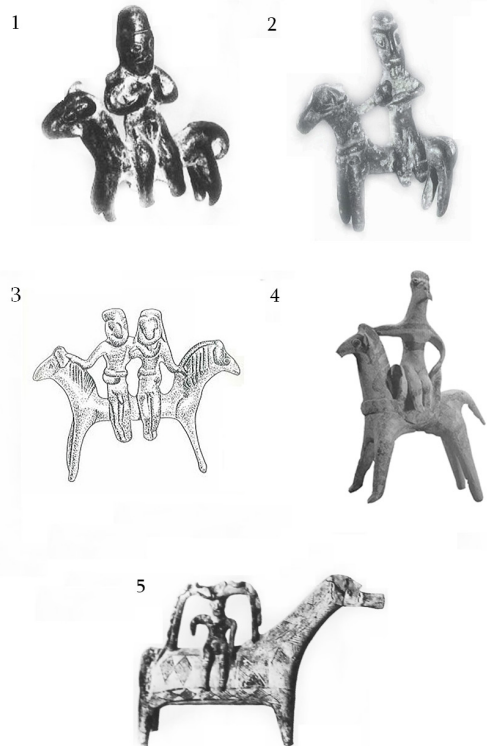
ტაბ. III Tab.

პონესის გარდა, მოპოვებულია ლესბოსსა და მეგარა ჰიბლეაში. გეომეტრიულ პერიოდში ცხენზე გვერდულად მჯდომი მხედრები მზადდებოდა კონკრეტულად საკურთხევლებზე მისამღვნილად. როგორც ბრინჯაოს ხანის ფიგურების შემთხვევაში, გეომეტრიული ხანის ნიმუშები, როგორც ჩანს, ასევე რელიგიურ მნიშვნელობას ატარებდნენ ათენას, არტემიდესა და ჰერას საკურთხევლებში (Voyatzis, 1990, გვ.106-107).