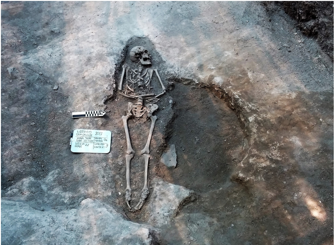
სურ. 5 Pic.

ქართული წერილობითი წყაროებიდან, სამშვილდის დაარსების შესახებ ცნობებს „ქართველთა ცხოვრება“ გვამლევს. წყაროს მიხედვით, ვიგებთ, რომ სამშვილდე ჯერ კიდევ ფარნავაზის ეპოქამდე, წარმოადგენდა მნიშვნელოვან ციხე-ქალაქს. „ცხოვრება ქართველ-