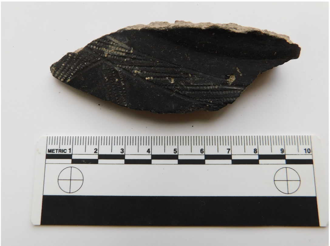
სურ. 3 Pic.

• განვითარებული შუასაუკუნეების მასალაში მნიშვნელოვანია კერამიკა, რომელშიც განირჩევა როგორც სამშენებლო ნაწარმი (კრამიტი), ისე საყოფაცხოვრებო ჭურჭელი. ეს უკანასკნელი მოჭიქული და სადა ფრაგმენტებითაა წარმოდგენილი, რომელთა შო-