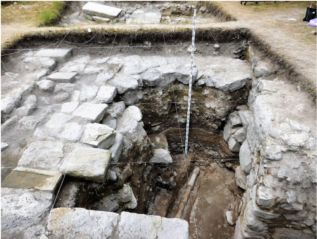
სურ. 2 Pic.

● 68-ე თხრილში გამოვლენილი დიდიფიცირებულ-მომრგვალებული ბაზალტის ლოდები და მათ დონეზე დაფიქსირებული მძლავრი კირის მოლესილობა, განვითარებულ შუასაუკუნეებში, სამშვილდის ციტადელში, დიდი ზომის ნაგებობის არსებობაზე უნდა მიუთითებდეს. სტრატეგრაფიულად, სწორედ ამ დონის ქვეშაა მოქცეული სამეურნეო ორმოები, საიდანაც ბრინჯაოს ხანის კერამიკის შავპრი-