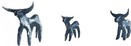
ტაბ. III Tab.

და ჰაგია ტრიადაზე აღმოჩენილია არა მხოლოდ ხარის, არამედ ცხენისა და სხვადასხვა მსხვილფეხა საქონლის ბრინჯაოს ფიგურები, რომელთა სახეობის დადგენა ხშირად შეუძლებელია. მხოლოდ ოლიმპიის მაგალითზე დღეისათვის გამოქვეყნებულია ცხრაასზე მეტი ამ ტიპის ნივთი (Heilmeyer, 1979), (ტაბ III). კოლხურ სამაროვნებსა და მის გარეთ აღმოჩენილი ზოგიერთი ხარის ფიგურა ახლო ანალოგებს პოულობს საბერძნეთის სხვადასხვა პუნქტში მოპოვებულ ხარის გამოსახულებებთან (Vachadze, 2016, p. 1099 – 1101).