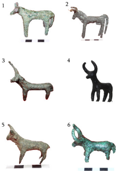
ტაბ. I Tab.

ზოომორფული ფიგურები უმეტესწილად სწორედ საკიდების სახით არის წარმოდგენილი. დღეისათვის, უახლესი გამოკვლევების შედეგად კოლხეთის არქეოლოგიური ძეგლებიდან ცნობილია ორმოცამდე ბრინჯაოს ზოომორფული სტატუეტი - სადგარი. ამათგან, ის ცალეები, რომელთა არქეოლოგიური კონტექსტი ცნობილია, არსებული ქრონოლოგიური ჩარჩოს მიხედვით ძვ. წ. VIII-VII საუკუნეებში ექცევა (პაპუაშვილი, 2010ა, გვ. 32-43).