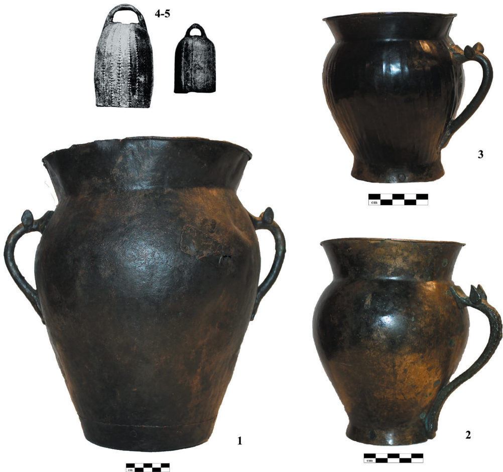
ტაბ. II. Tab.

ზაციამდელი კონტაქტების საკითხის კვლევისას ამ მონაპოვარს უდიდესი მნიშვნელობა ენიჭება. მოგვიანებით, ცაიშის კოლხურ კოლექტიურ სამარხებში აღმოჩენილი ანალოგიური სკულპტურების შესწავლის საფუძველზე შესაძლებელი გახდა ნივთების წარმოშობის არეალი კოლხეთთან გაიგივებულიყო [ჭაპუაშვილი. 2010. 50-51].