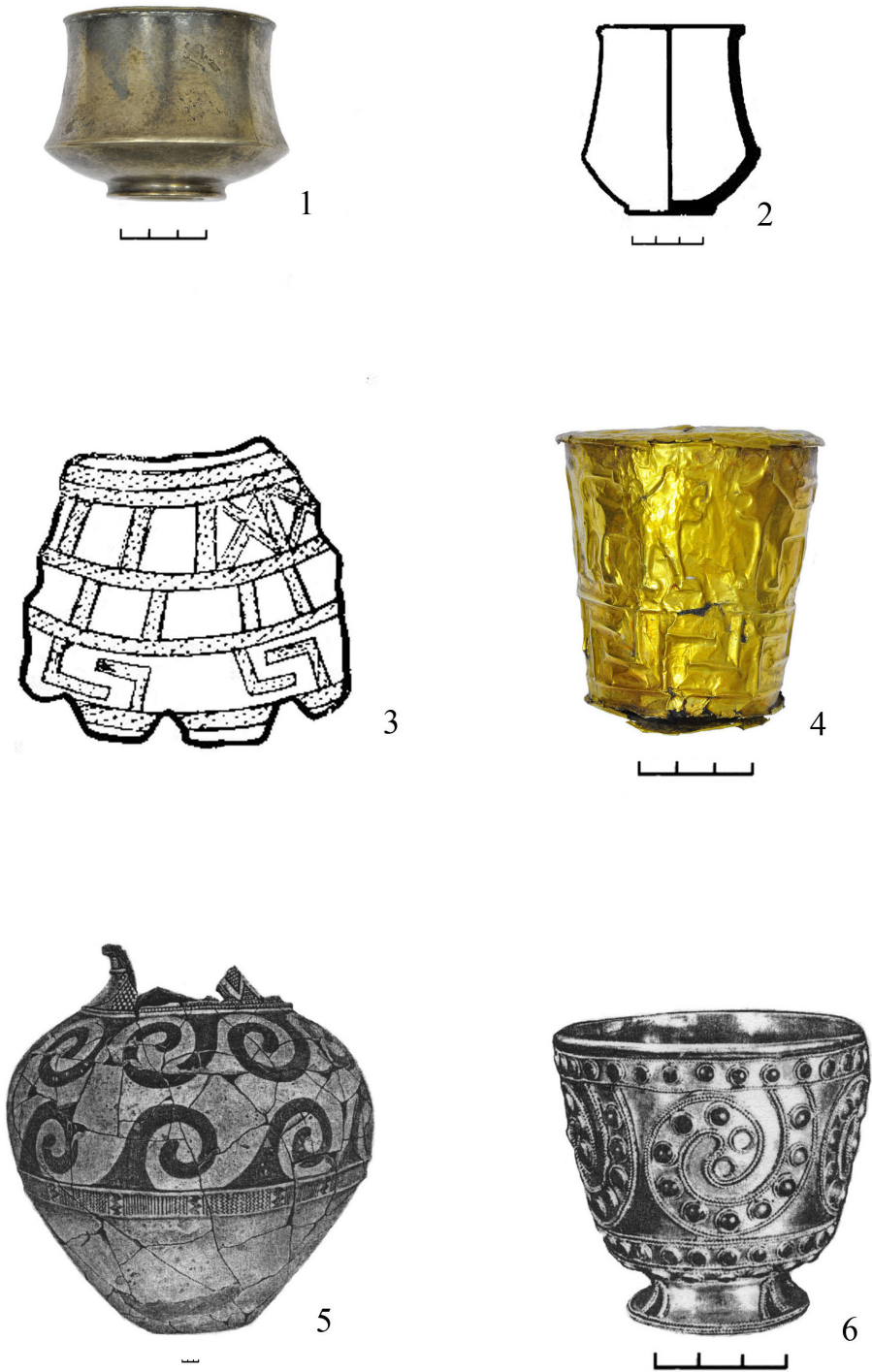
ტაბ. II ლითონის ჭურჭლის კერამიკის მინაბადები. ჭაბაშვილი ლ. 2012-ის მიხედვით. ტაბ. I